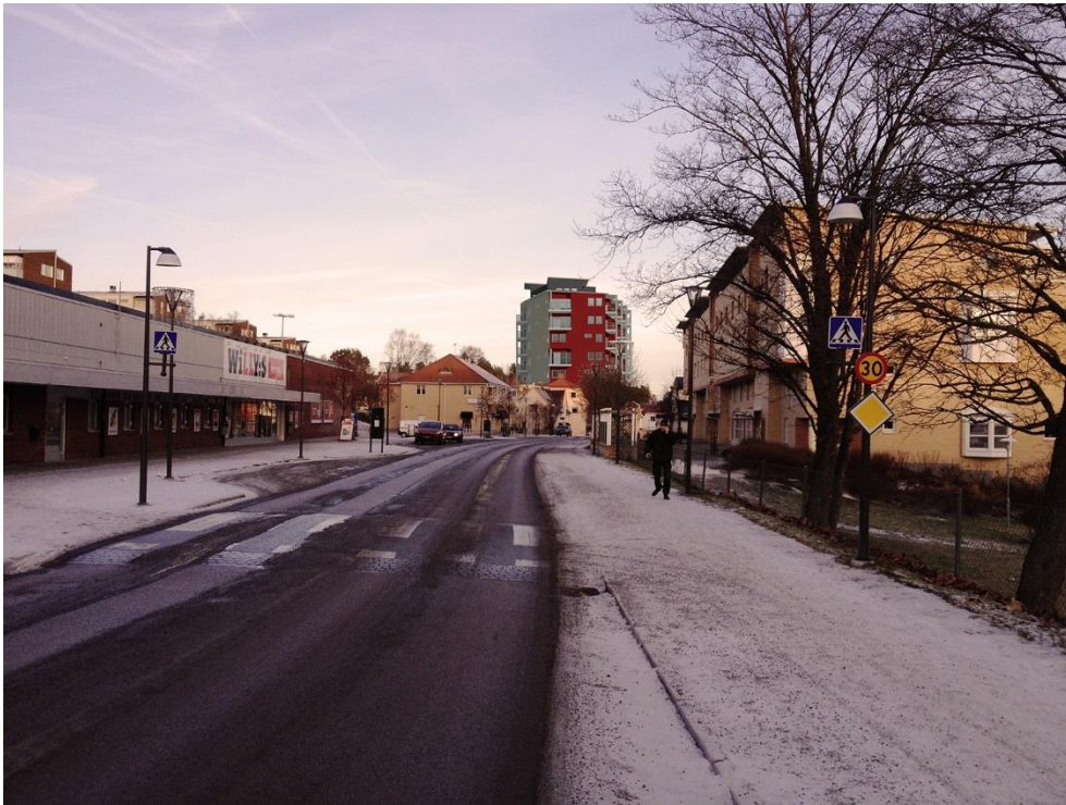
Köpmangatan mot norr, föreslagen illustration är endast avsedd som studie.