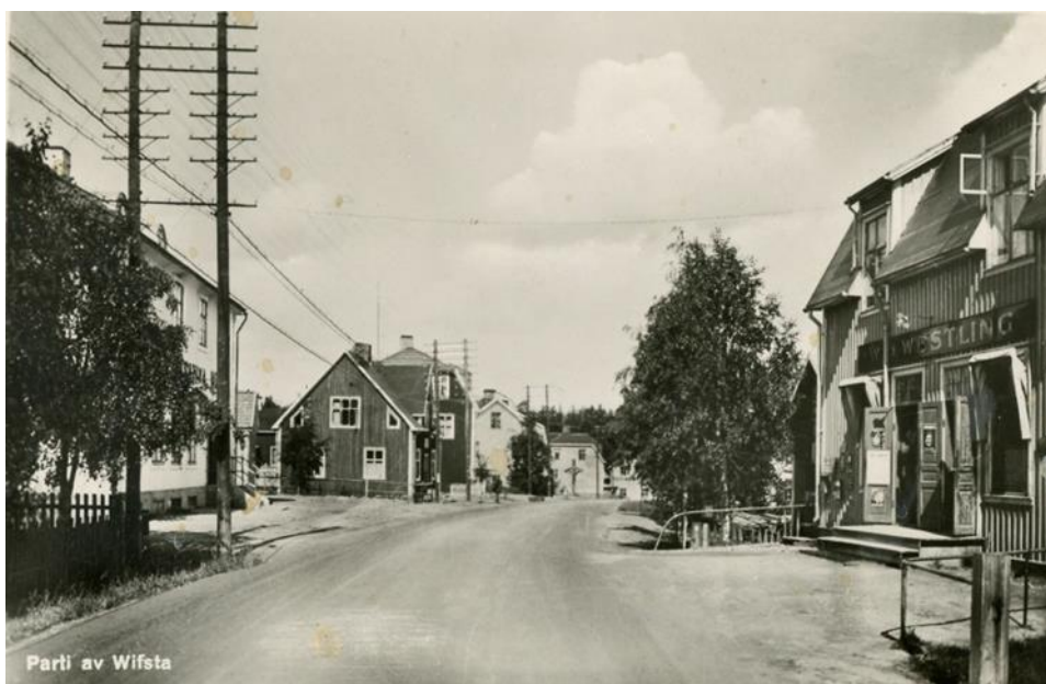
Köpmangatan sedd söderifrån, foto från 1930-talet

Stora delar av centrala Timrå är planlagda genom planerna S 103 fastställd 1963-09-27, S 108 fastställd 8 juni 1967, D 101 laga kraft vunen 1987-10-29 och slutligen D 172 upprättad 2010-03-26 som reglerar förhållanden längs Köpmangatans norra del. Fastigheterna Vivsta 3:10 och 3:11 angränsar till eller ligger i dessa planers närhet men är inte planlagda. S 103 omfattar bl. a. Vivsta 3:24, 3:58, 3:61 och del av 3:91 vilka fränsett Vivsta 3:24 redan nyttjas av AB Timråbo för parkeringsändamål.