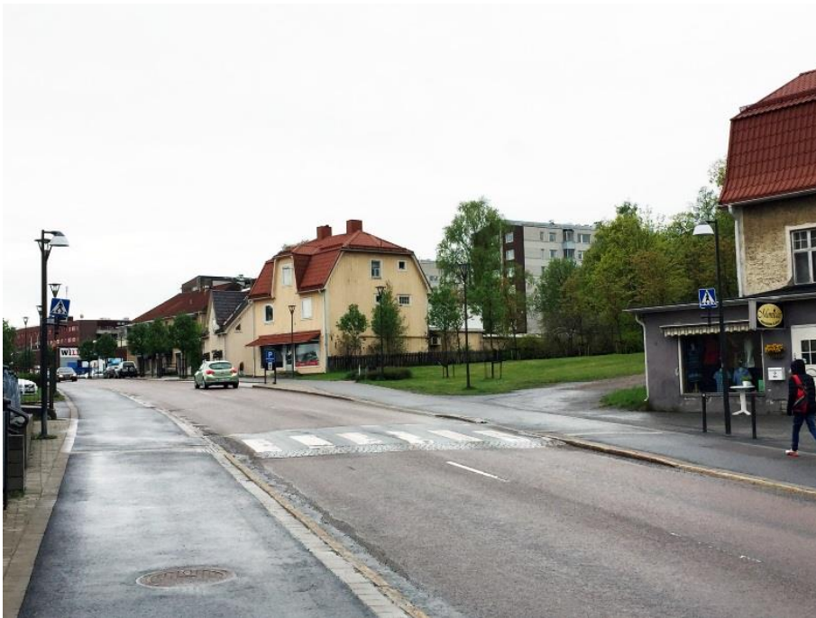
Köpmangatan från norr vid planområdet.

Inom planområdet är Vivsta 3:10, 3:11 och 3:24 är obebyggda. Vivsta 3:58 och 3:61 består av parkeringsplatser anlagda under 1960- och 70-talen. Planområdet omgivning består i söder och norr av tvåvånings trähus, de sista resterna av centrala Timrås äldre bebyggelsestruktur. Väster om planområdet finns ett antal bostadshus i 6 våningar ställda i öst-västlig riktning ägda av AB Timråbo. På Köpmangatans östra sida finns ett punkthus byggt på 1970-talet samt flerfamiljshus byggda under främst 1960-talet. Det är således en splittrad stadsbild som uppvisas kring planområdet.