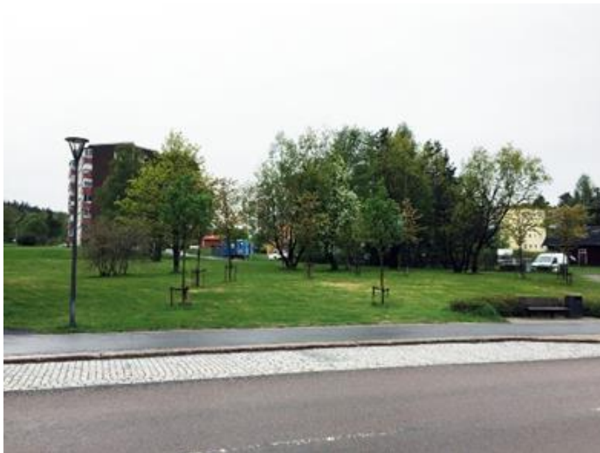
Planområdet från Köpmangatan.