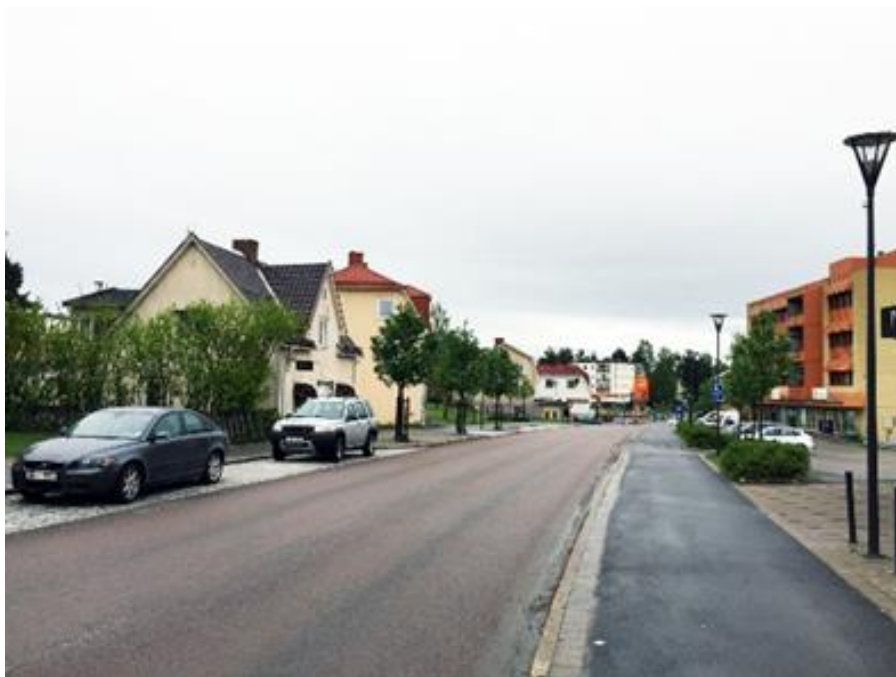
Köpmangatan sett mot norr.

Innan industrialiseringen var Vivsta ett jordbrukssamhälle, landsvägen norrut mot Härnösand gick genom samhället och efterhand uppkom bebyggelse längs nuvarande Köpmangatan. När sågverksindustrin från 1850 - 60-talen och senare massindustrin etablerade sig på Vivstavarv och Östrand blev Vivsta ett komplementsamhälle som försåg industrisamhällena med olika former av service. Under främst 1960-talet och därefter ansågs bebyggelsen i Vivsta omodern och inte kunna svara mot tidens behov varför en saneringsprocess inleddes som pågick fram till mitten av 1980-talet. Största delen av Vivsta i centrala Timrå förändrades därmed.