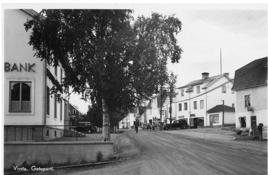
Köpmangatan norrifrån, planområdet vid bildmitten.